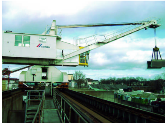
Greifer-Drehkran (Hersteller Hilgers)