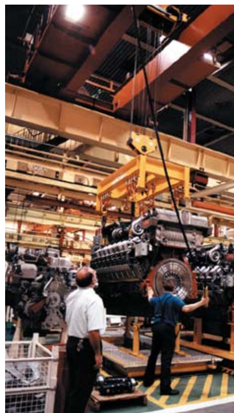
Dieselmotor von Cummins