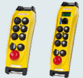
S11 Ein Hubwerk