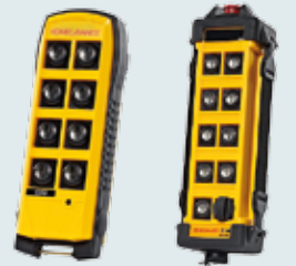
QU Ein Hubwerk