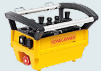
SP Ein oder zwei Hubwerke